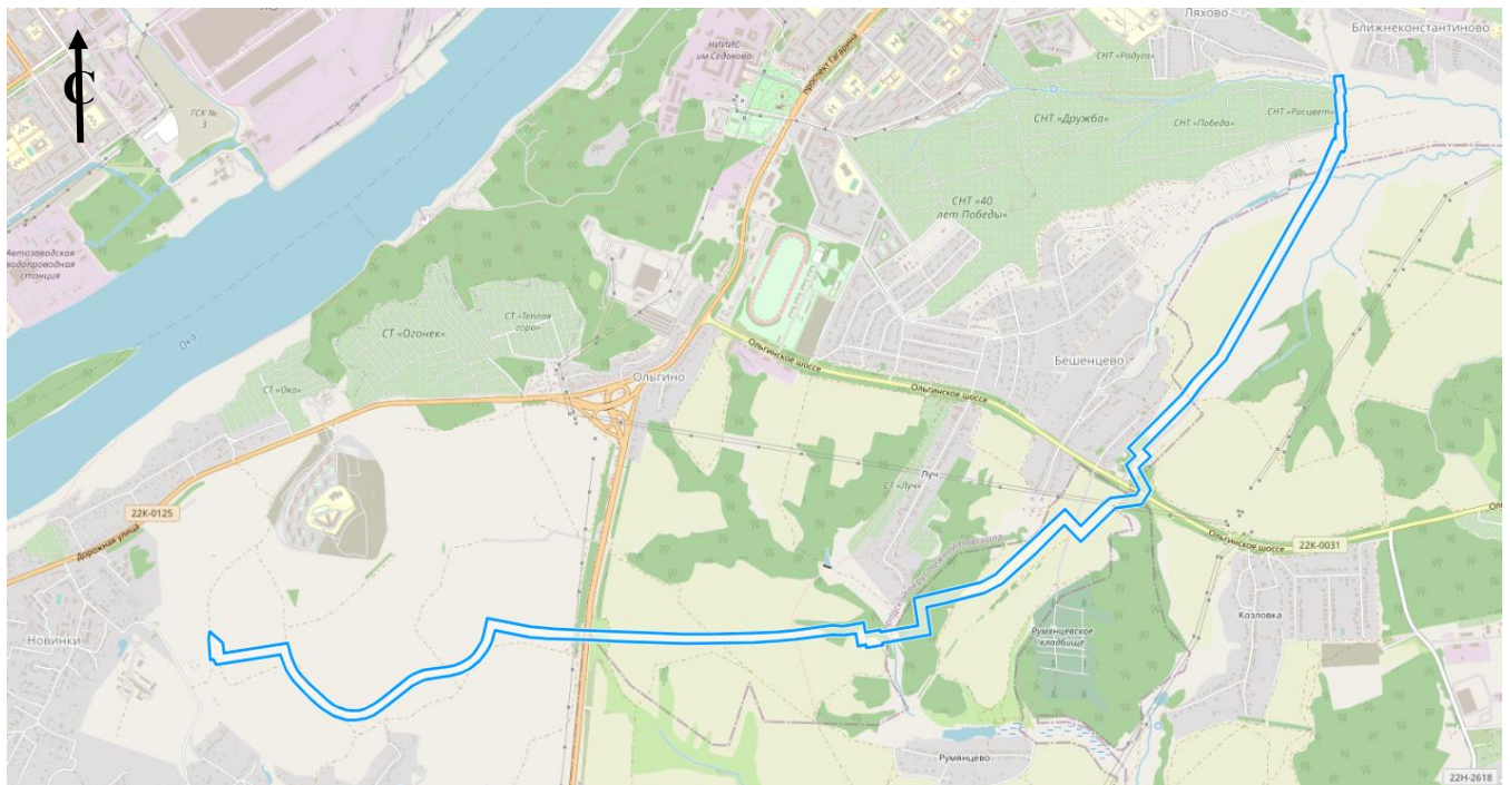
Схема границ подготовки документации по планировке территории (арх. № 195/22)

«ПРИЛОЖЕНИЕ» к приказу министерства градостроительной деятельности и развития агломераций Нижегородской области от 9 декабря 2022 г. № 06-01-02/82